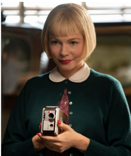
Michelle Williams in haar Oscar genomineerde rol als moeder van Steven Spielberg

Ondanks de lengte van de film (151 minuten) blijf je geboeid door de biografie van Spielberg als filmmaker én de algehele filmmagie!