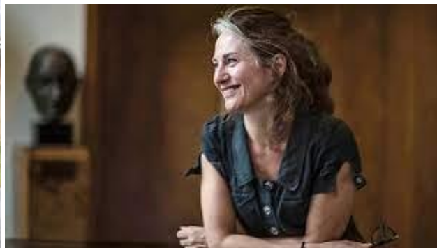
Schrijfster Rachel Joyce