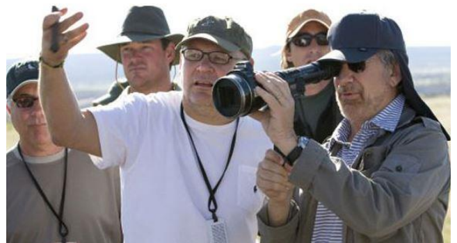
Steven Spielberg (rechts) aan het werk