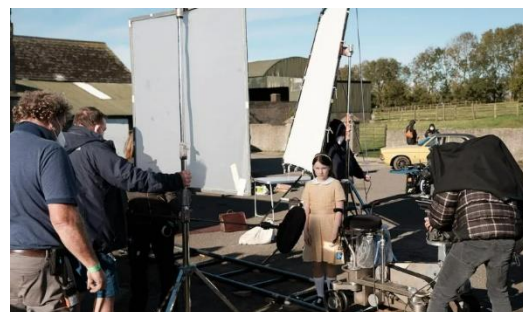
Kate McCullough (* director of photography)